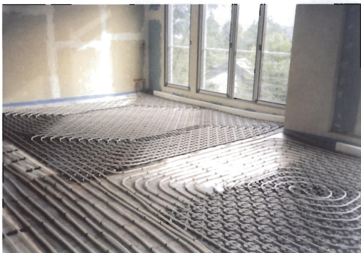
proKlima Systemfläche mit Heiz-/Kühlrohr vor Estricheinbringung