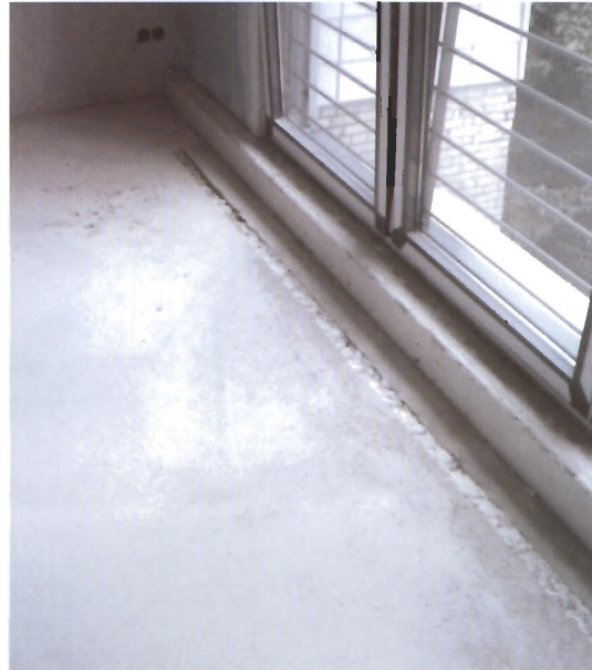
Luftauslass-Öffnungen nach Estricheinbringung