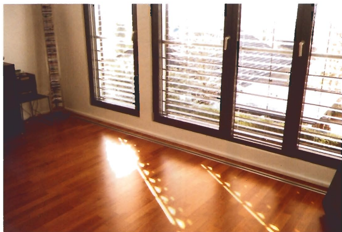
verlegter Oberboden Wohnen mit Luftauslass-Schlitzschiene