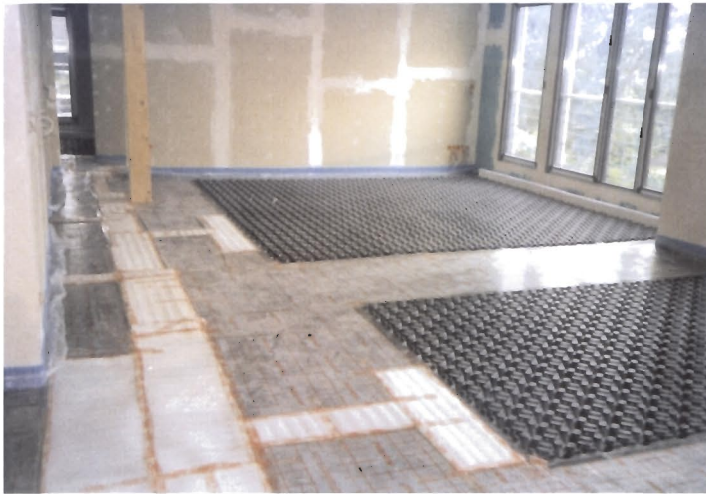
Verlegte proKlima Systemfläche