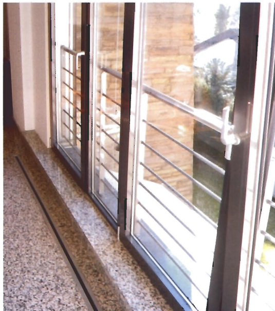
verlegter Oberboden Küche mit Schlitzschiene